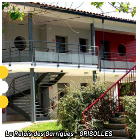
Le Relais des Garrigues - GRISOLLES