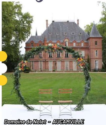
Domaine de Nolet - AUCAMVILLE