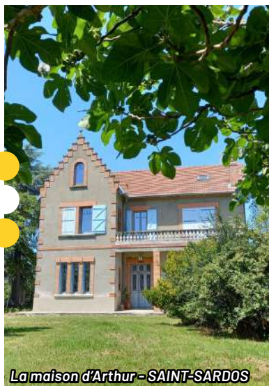
La maison d'Arthur - SAINT-SARDOS

À partir de 70€ la nuit. Petit-déjeuner non inclus. Sanitaire sans douche.