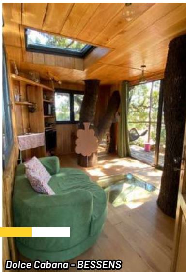
Dolce Cabana - BESSENS