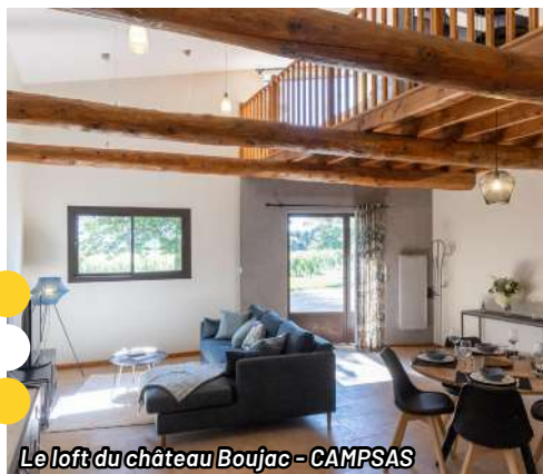
Le loft du ch teau Boujac - CAMPSAS