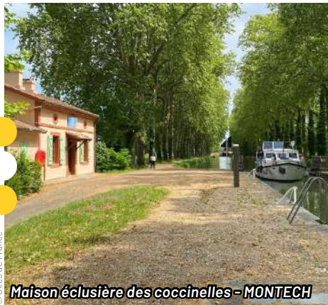
Maison éclésièrre des coccinelles - MONTECH