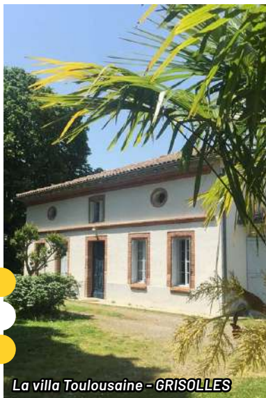
La villa Toulousaine - GRISOLLES