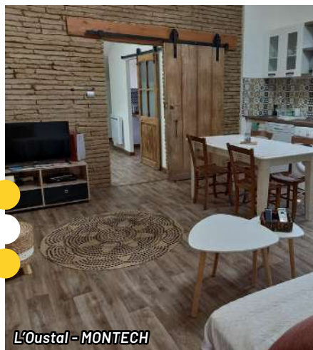
L'Oustal - MONTECH