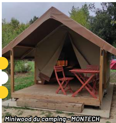
Miniwood du camping-MONTECH