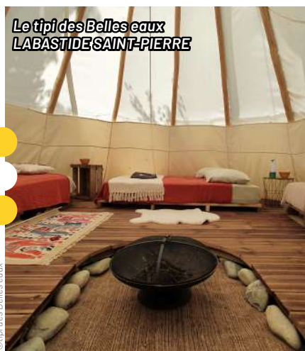
Le tipi des Belles eaux LABASTIDE SAINT-PIERRE